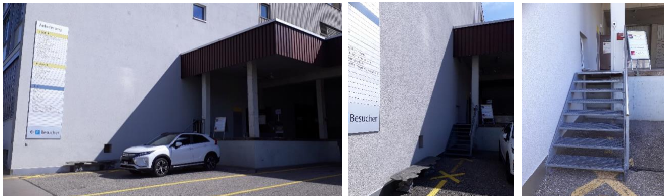
Zugang mit Lift (2. Stock)

Wieder zurück Richtung Einfahrt ins Areal und dann nach links zur Verloaderampe.